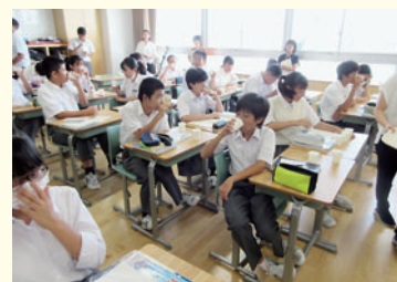
出汁の授業の様子

の味を感じることができるといいう実験です。結果は、昆布出汁が「うま味」と結び付かない生徒が多くいました。今の食生活では複合的な出汁を使うことが多く、昆布単体で取る出汁に慣れていないと考えられます。今から100年前、シンプルな昆布出汁を日常的に使っていた日本人だからこそ、発見できた味覚だったということが分かりました。