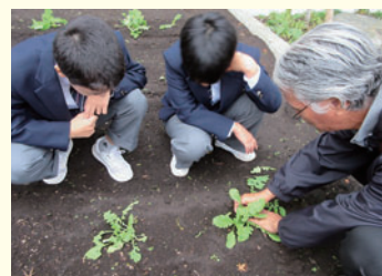
江戸東京野菜 畑の先生から指導を受ける様子

馬大根」の栽培を試みました。虫や強風にやられるなど試行錯誤の連続でしたが、収穫できた野菜は味が濃くて美味しかったです。感染症の終息後に授業で活用できるように、技術科と連携して整備をしていきます。