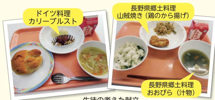
生徒の考えた献立

の料理も含まれます。長野の祖母宅で習った郷土料理や、短期留学先のドイツで作った料理など、いつも力作ぞろいです。その中からいくつか