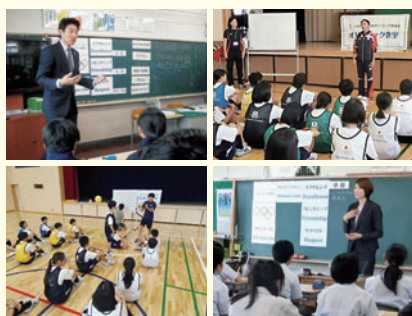
オリンピック教室の様子

味の素ナショナルトレーニングセンターに隣接する本校は、平成26年度オリンピック教育推進校の指定を受けました。