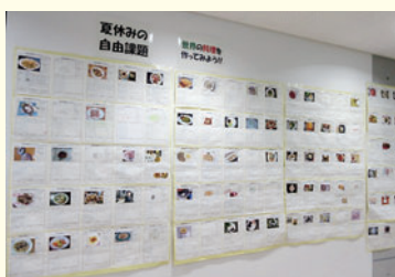
夏休みの自由課題 掲示

また、北区はハンガリーの選手団の事前キャンプ地となっていることから、区として学校給食にハンガリー料理を提供する取り組みが行われました。本校では、この取り組みと、先でも紹介する農林水産省の和牛肉提供推進事業※とコラボレーションをして、和牛肉を使用したハンガリー料理を提供しました。この日の献立のレシピを次頁に紹介します。