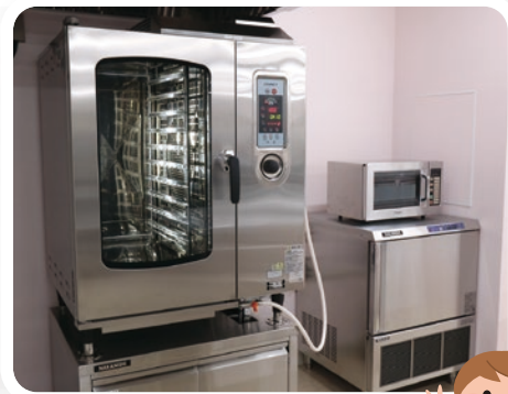
左 スチームコンベクション 右 クイックチラー、業務用電子レンジ