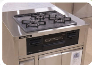
3口コンロ、グリル、大型シンク、 大理石天板を設置しています。