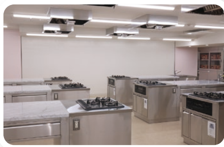
ホワイトボードウォール