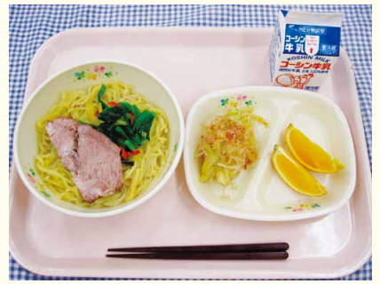
給食に出した鯛だし塩ラーメン

「香りたつみそラーメン」、「鯛だし塩ラーメン」の3種類のラーメンだった。子どもたちもどこか特別な給食であることを感じながら味わって食べる様子が見られ、「チャーシューはどうやって作ったのですか?」などとチーフにたずねる子どももいた。こうしたこだわりのラーメンを出して以来、調理員と子どもの距離が近づき、調理員に給食のリクエストや感想を直接伝える子どもが増えたと感じる。