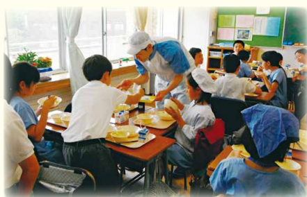
子どもと調理員の交流(給食時)

給食では、子どもたちと給食調理員の間に関わり合いを大切にしたいと考え、1年次から行っている調理員の給食時間の教室訪問に加えて、それぞれの調理員の得意分野を生かした給食を提供することにした。普段は栄養教諭が考えている料理の材料や味付けを、調理員から提案してもらった。ラーメンの知識が豊富な調理主任(チーフ)から提案されたのは、「あごだししょうゆラーメン」。